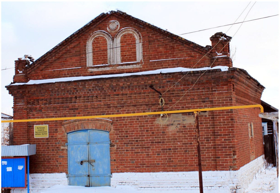
Фото 5: В этом здании размещался магазин (склад) Мухаметзяна Ахметзянова.