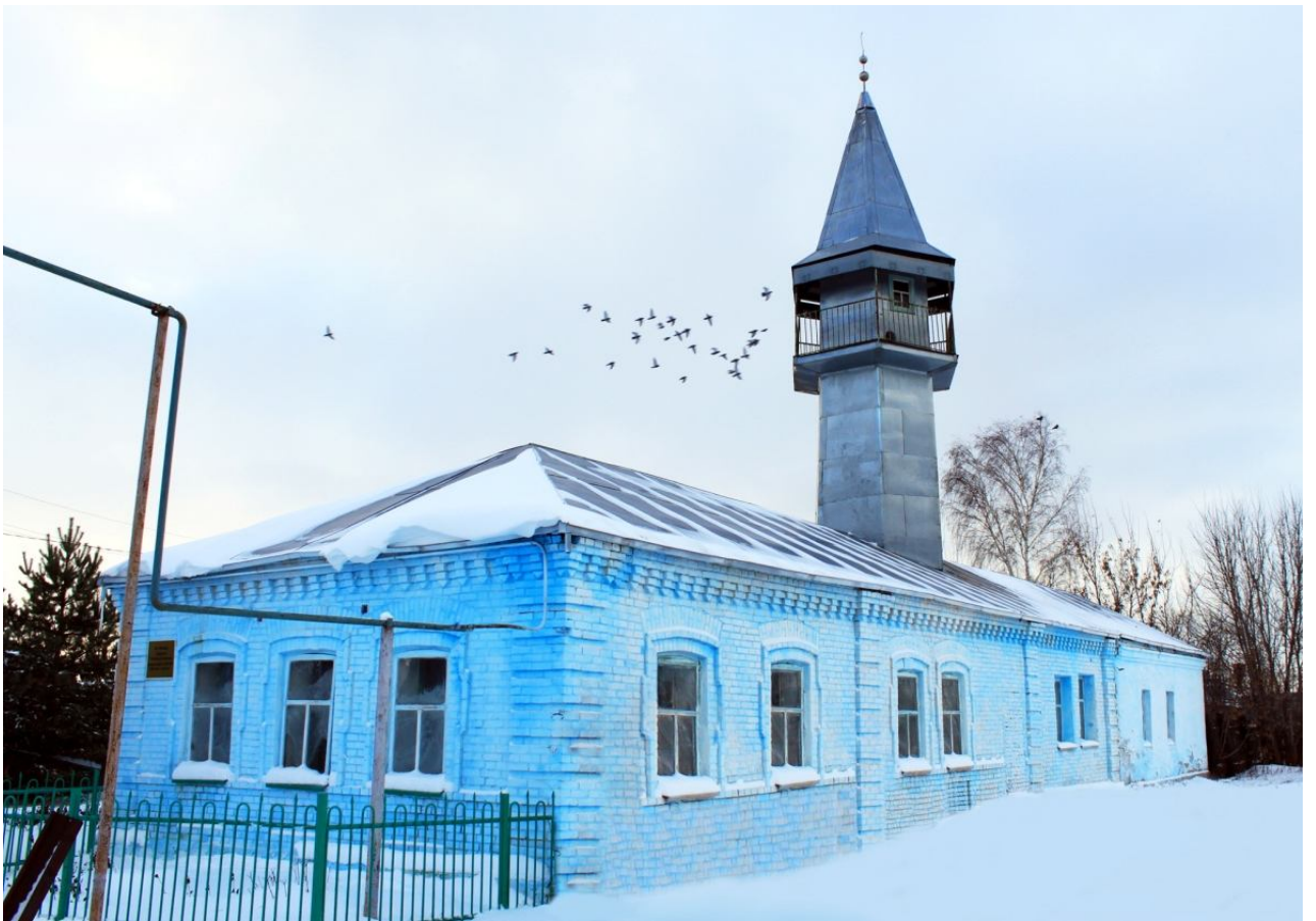
Фото 6: В этом здании располагался гостевой дом Габдуллы Губайдуллина, 1889 г.