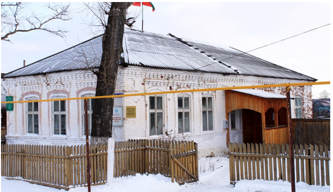
Фото 7: В этом здании жил купец Арслан Гали, 1886 г.