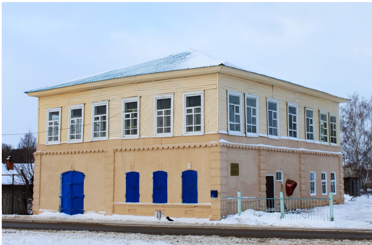
Фото 10: В этом здании с 1907 по 1922 годы жили знаменитые просветители Габдулла, Губайдулла, Мухлиса Нигматуллины-Бобинские.