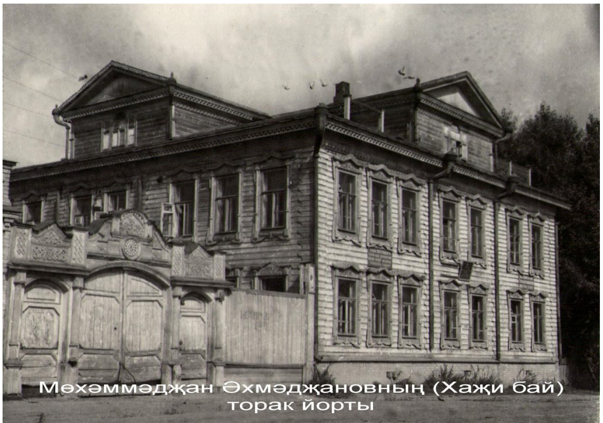
Фото 4: Дом купца Мухаметзяна Ахметзянова.