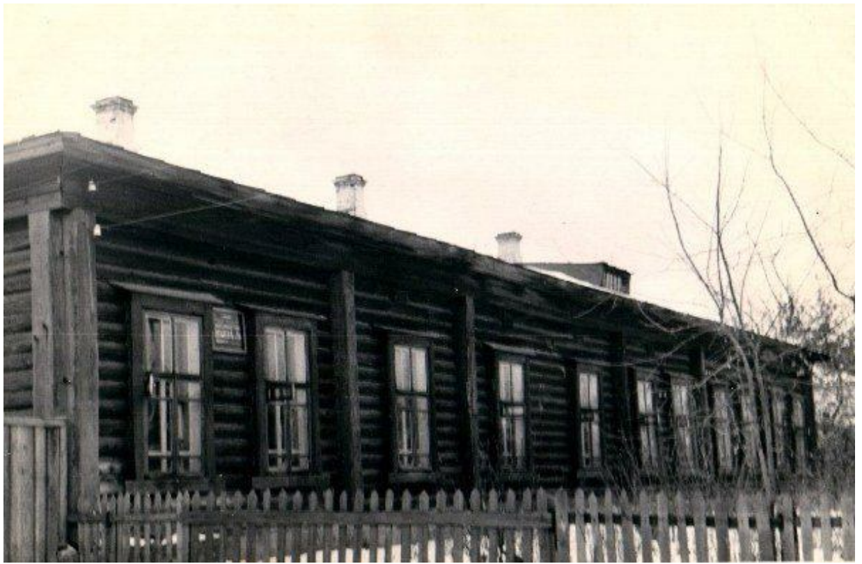
Фото 8: В этом здании в к. 19- н. 20 века находилось мужское медресе. Позже здание разобрано и увезено в г. Агрыз.