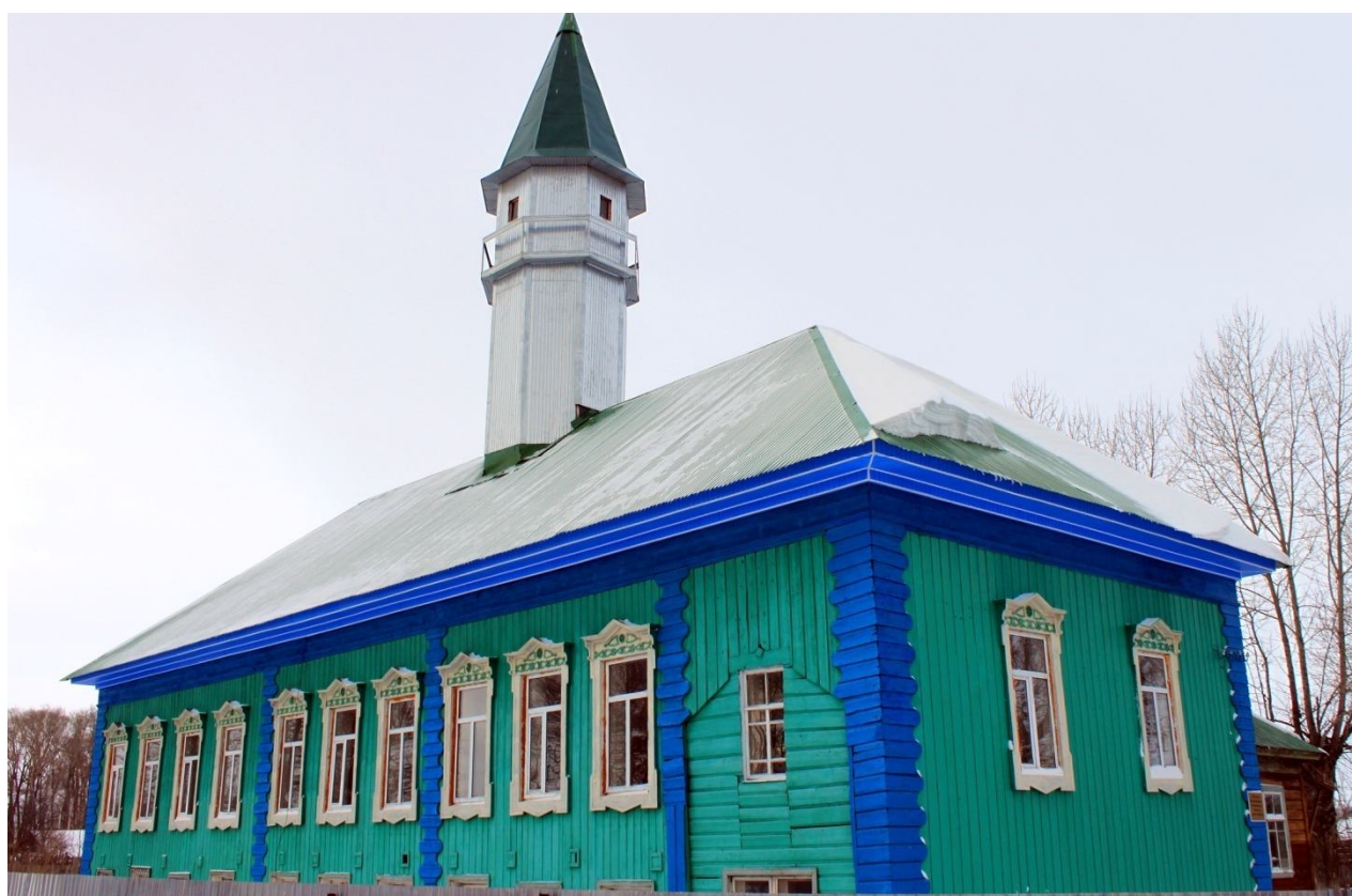
Фото 11: Мечеть построенная на средства купца-мецената Мухаметзяна Ахметзянова, 1895 г.